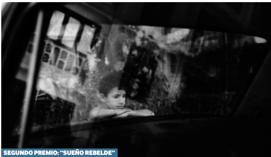
SEGUNDO PREMIO: "SUEÑO REBELDE"

es obra de un bilbaíno de 27 años, licenciado en Comunicación audiovisual que comenzó a interesarse por la fotografía a la edad de 20 años.