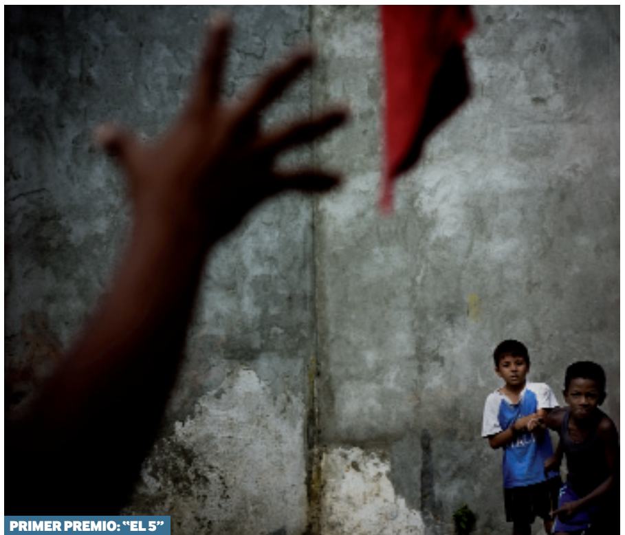
PRIMER PREMIO: “EL 5”

Según aseguró López Vañó, durante el viaje, que duró unos dos meses, consiguió integrarse por completo en las vidas de las