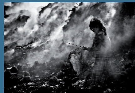
"LA MONTAÑA DE HUMO"